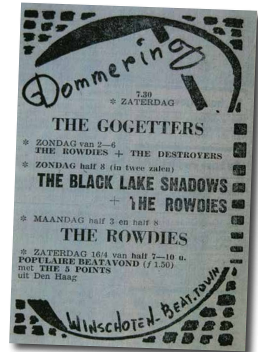
▲ Popconcert in Dommering

felle brand de schouwburgzaal volledig verwoest. In het deel dat bespaard blijft, wordt een dancing en discotheek gestart, maar een volgende brand in 1971 legt het resterende deel plat. Het is over en uit met het nog altijd geroemde Dommering.