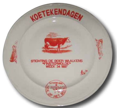
▲ Herinneringsbord koetekendagen