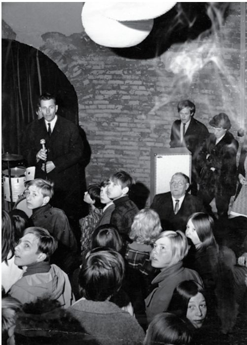
▲ De opening van Stone Free

popbands ruimte geeft, openen. Short Purse, Home Flight Selection en The Movees ontplooiën zich. Stone Free staat voor easy going , relaxen, discussiëren over de lokale politiek, hapje en drankje en... De reputatie van drugshol is de politiek een doorn in het oog, waardoor het centrum op slot gaat.