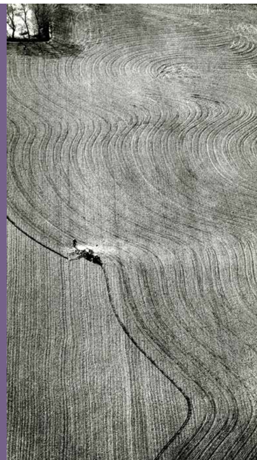
▲ Cancelled Crop van Dennis Oppenheim

Enkele maanden later volgde Cancelled Crop : Waalkens trok met een dorsmachine een kruis over de akker, ten teken dat het project was voltooid. Het kunstwerk dat Oppenheim van dit project afleidde, bevindt zich in de collectie van enkele gerenommeerde musea in Europa.