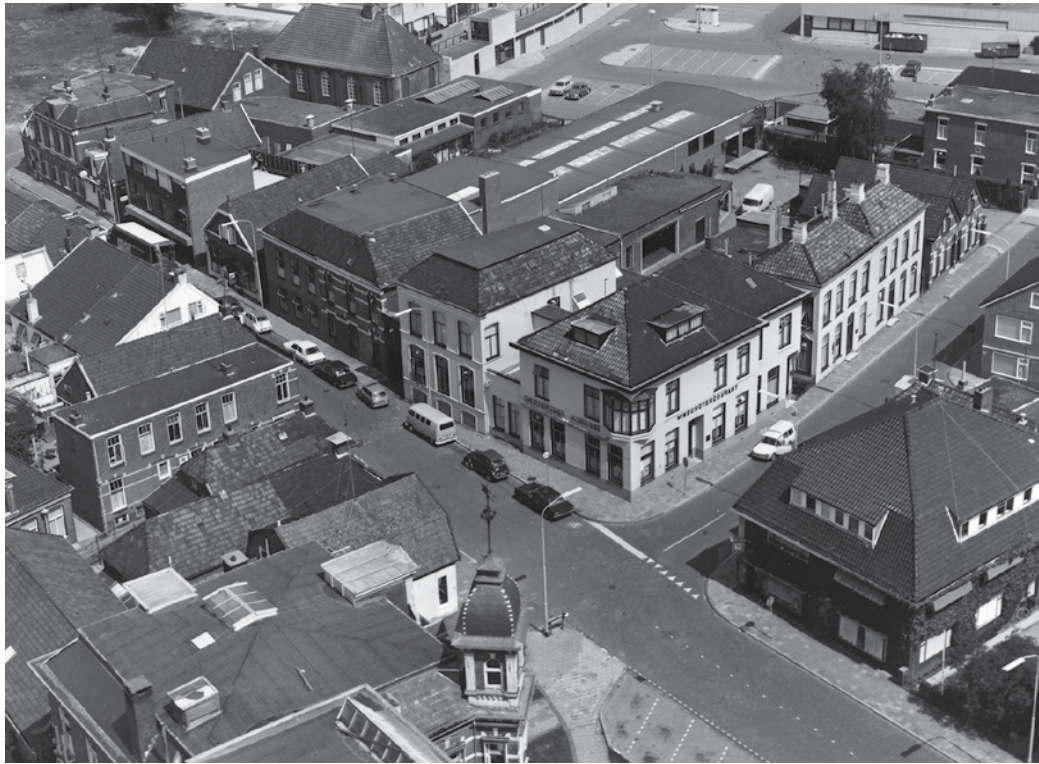
▲ Het gebouw van de Winschoter

zit ingeklemd tussen Hazewinkel Pers (uitgever van concurrent Nieuwsblad van het Noorden) en Wegeners Couranten Concern, dat in 1974 en 1975 de aandelen van de Drents Groningse Pers (DGP) overneemt. In 1979 wordt Wegener de nieuwe eigenaar. In 1992 wordt de Winschoter Courant eerst ochtendblad en de naam gewijzigd in Groninger Dagblad. Twee jaar later verkoopt Wegener de