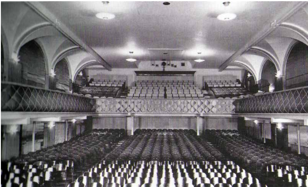
▲ De grote zaal